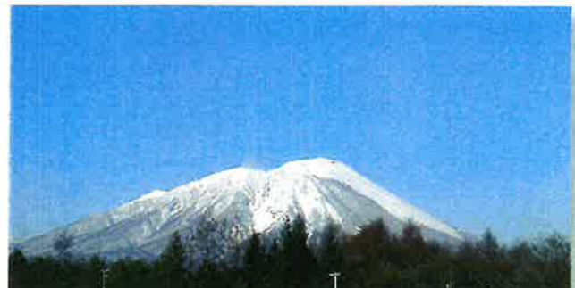
施設内から望む初雪を抱いた岩手山