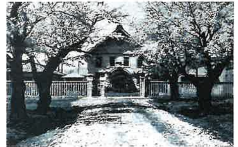
明治20年に建築された旧施設