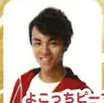
よこつちピーマン