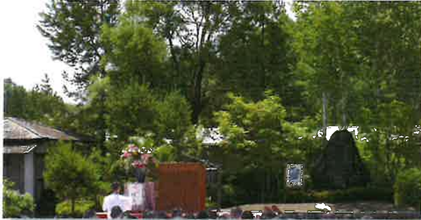
高村光太郎祭の様